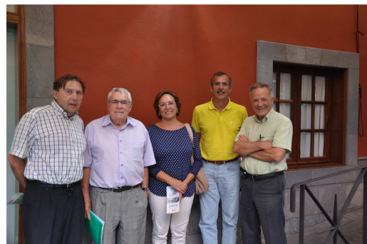
Miembros de la Junta Directiva y del Patronato presentes en el acto

En el convenio se especifica que la colaboración que se establece se fundamenta en la voluntad de las dos partes por trabajar en pro de este objetivo que comparten: ayudar solidariamente a actividades de educación y sanidad en Iberoamérica. En esta edición, existe una cláusula según la cual al convenio se le da vigencia en los años 2014 y 2015.